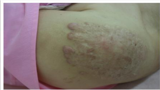
施術 5週 後